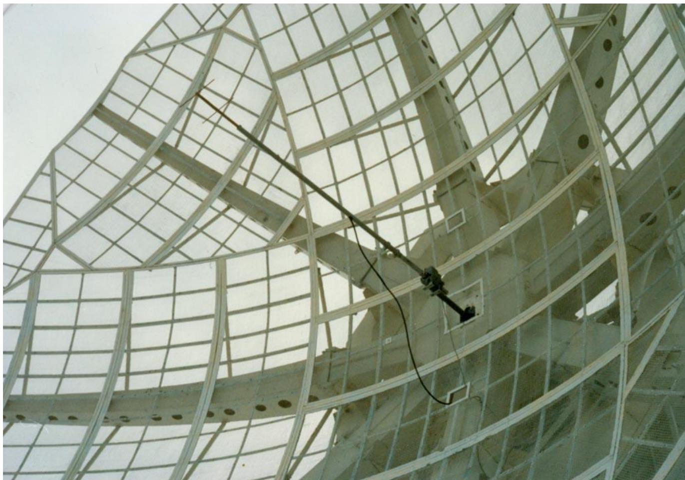
Parabola 10m, f/D 0,26, síto 10x10mm s ozařovačem reflektor/dipól – rotační uspořádání