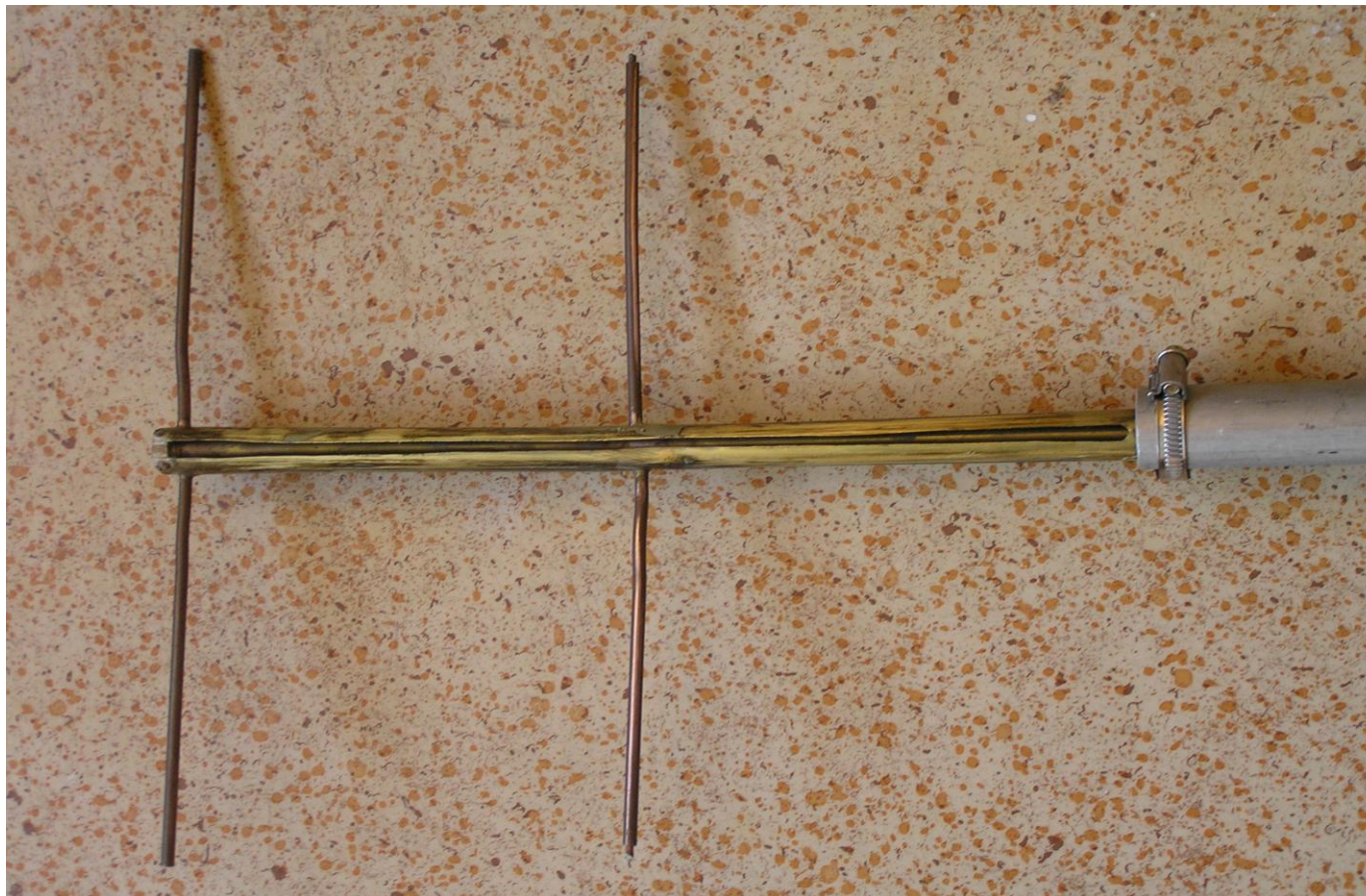
Detail 18 let starého ozařovače dipól/reflektor